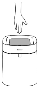
4. Ruční nasazení pytle na odpadky