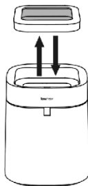
2. Vyměňte kroužek uvnitř