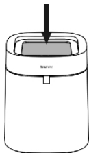
3. Vložte vnější kroužek zpět