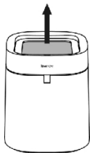
1. Remove the outer ring